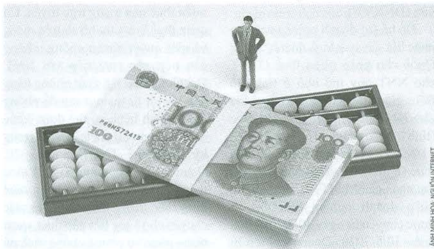
Để hỗ trợ doanh nghiệp tư nhân phục hồi sản xuất kinh doanh, Trung Quốc cho phép miễn thuế GTGT cho NNT quy mô nhỏ ở tỉnh Hồ Bắc

Thuế TNCN được chậm nộp đến tháng 8/2020. Các khoản khấu trừ chi phí bảo hiểm y tế tăng từ 15.000 baht lên đến 25.000 baht. Miễn thuế TNCN đối với các khoản thanh toán rủi ro cho nhân viên y tế. Khấu trừ thuế tại nguồn áp dụng cho thanh toán dịch vụ, thuê công việc, hoa hồng sẽ được giảm từ 3% xuống 1,5% cho các khoản thanh toán được thực hiện từ ngày 1/4 đến ngày 30/9/2020. Tỷ lệ này sau đó được giảm xuống 2% từ ngày 1/10/2020 đến ngày 31/12/2021 nếu việc thanh toán được thực hiện thông qua hệ thống điện tử. Các cá nhân đầu tư vào Quỹ siêu tiết kiệm (SSF) với chính sách đầu tư ít nhất 65% giá trị tài sản ròng vào cổ phiếu niêm yết trên Sở giao dịch chứng khoán Thái Lan, trong khoảng thời gian từ ngày 1/4 đến ngày 30/6/2020 có thể khấu trừ số tiền đầu tư thực tế (không quá 200.000 baht) vào thuế TNCN với điều kiện là khoản đầu tư vào quỹ sẽ được giữ trong ít nhất 10 năm. Thời hạn nộp hồ sơ khai thuế