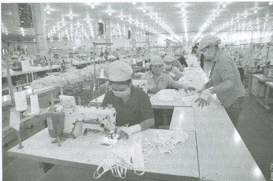
Cần có những biện pháp cấp bách về chính sách thuế nhằm hỗ trợ doanh nghiệp và người dân để giảm thiểu những tác động của đại dịch Covid-19

Thứ tư, đẩy mạnh xúc tiến triển khai dịch vụ thuế điện tử eTax. Thực hiện kế hoạch triển khai mở rộng hệ thống dịch vụ thuế điện tử, hiện nay Tổng cục Thuế đã đưa hệ thống eTax đi vào hoạt động chính thức tại 45 tỉnh/thành phố. Thay vì triển khai eTax cho 18 tỉnh/thành phố còn lại vào tháng 11 như dự kiến, Tổng cục Thuế nên gấp rút chuyển sang thực hiện ngay trong tháng 6♦