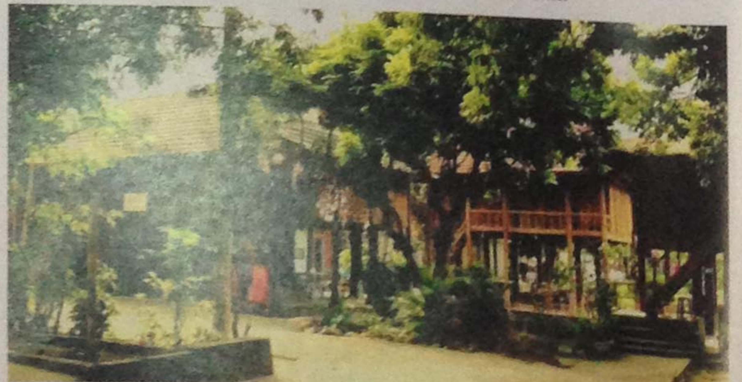
Bản Lác (huyện Mai Châu) là một trong những điểm du lịch thú vị và được nhiều du khách lựa chọn cho các chuyến du lịch trải nghiệm

Cuối năm 2018, tỉnh Hòa Bình đã trao Quyết định chủ trương đầu tư về du lịch và bất động sản cho 9 nhà đầu tư, thực hiện 9 dự án; ký Bản ghi nhớ đầu tư với 15 nhà đầu tư, thực hiện 19 dự án trên địa bàn tỉnh với mức đầu tư lên tới 94.000 tỷ đồng. Năm 2019, tỉnh đón gần 3 triệu lượt khách du lịch, trong đó có trên 400 ngàn lượt khách quốc tế, tổng thu từ hoạt động du lịch dự kiến đạt khoảng 2.000 tỷ đồng, đóng góp không nhỏ cho ngân sách địa phương. Đến nay, toàn tỉnh đang có 407 cơ sở lưu trú du lịch, trong đó có 32 khách sạn, 233 nhà nghỉ và 142 nhà sàn.