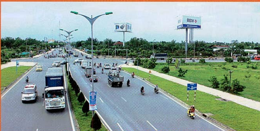
Những tuyến đường giao thông hiện đại được đầu tư xây dựng.