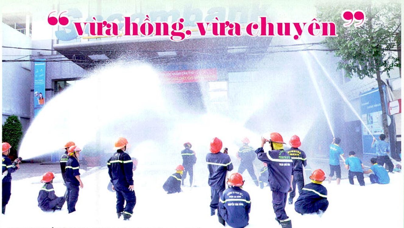
Toàn cảnh buổi diễn tập phương án chữa cháy và cứu nạn, cứu hộ tại Ngân hàng Sacombank chi nhánh Cần Thơ.