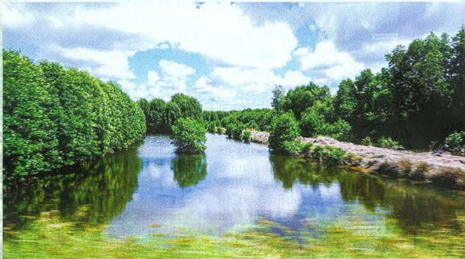
Rừng đước Cà Mau.

ĐBSCL, các địa phương trong vùng và TPHCM đã có nhiều nỗ lực tăng cường liên kết, hợp tác phát triển du lịch. Các tỉnh, thành và các bộ, ngành đã có tiếng nói chung, thông qua nhiều hoạt động thiết thực. Các địa phương trong vùng ĐBSCL cũng đã ký kết với nhau và với TPHCM các chương trình hợp tác du lịch, xây dựng, phát triển nhiều sản phẩm du lịch đặc thù và triển khai thực hiện. Sự phát triển của ngành du lịch đã