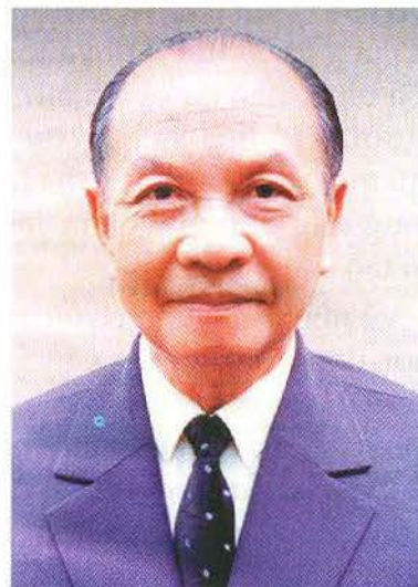
Đồng chí Trường Chinh (1907-1988)

Đồng chí Trường Chinh, nguyên Tổng Bí thư Ban Chấp hành Trung ương Đảng Cộng sản Việt Nam, nguyên Chủ tịch Hội đồng Nhà nước nước Cộng hòa xã hội chủ nghĩa Việt Nam, nguyên Cố vấn Ban Chấp hành Trung ương Đảng Cộng sản Việt Nam, "người cộng sản kiên cường, mẫu mực, nhà lãnh đạo có uy tín lớn của Đảng, Nhà nước và Nhân dân ta, nhà văn hóa và nhà báo lớn", "người học trò xuất sắc của Chủ tịch Hồ Chí Minh", "được nhân dân ta và bạn bè trên thế giới tin yêu, kính trọng" 1 . Cuộc đời hoạt động cách mạng sôi nổi và phong phú của đồng chí gắn liền với những chặng đường đấu tranh vẻ vang của Đảng và dân tộc ta, đặc biệt là ở những thời điểm mang tính bước ngoặt, những sự kiện trọng đại của cách mạng Việt Nam. Tài năng, trí tuệ của đồng chí được thể hiện trên nhiều lĩnh vực. Đồng chí không chỉ là một nhà lãnh đạo kiệt xuất của Đảng và Nhà nước ta, mà còn là nhà lý luận, nhà báo, nhà văn hóa lớn của nước nhà.