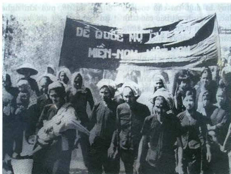
"Đội quân tóc dài" nổi tiếng đi đầu trong các cuộc đấu tranh chống Mỹ và tay sai. Ảnh tư liệu

mạng, có tính kỷ luật cao, có tình thương yêu "đồng đội" sâu sắc, tin tưởng nhau tuyệt đối, phối hợp nhau chặt chẽ, sống cùng sống, chết cùng chết, sẵn sàng hy sinh vì lý tưởng cách mạng. Đảng đã lãnh đạo "Đội quân tóc dài" làm nòng cốt trong các cuộc nổi dậy của quần chúng, có hiệp đồng tác chiến chặt chẽ nên đã hạn chế thương vong, thất bại, nhất là không để nhân dân đấu tranh tự phát mà được tổ chức chặt chẽ, có lý luận sắc bén và sẵn sàng đối phó mọi âm mưu, thủ đoạn đàn áp của kẻ thù.