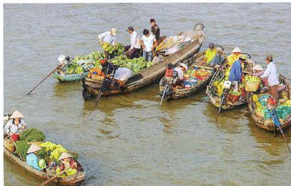
Chợ nổi bán nhiều nhất là nông sản, trái cây.

CHỢ NỔI CÁI RĂNG (CẦN THƠ) LÀ MỘT TRONG NHỮNG CHỢ NỔI LÂU ĐỜI VÀ THÚ VỊ NHẤT Ở MIỀN TÂY SÔNG NƯỚC, ĐÃ VÀ ĐANG THU HÚT NHIỀU DU KHÁCH TRONG VÀ NGOÀI NƯỚC ĐẾN THAM QUAN, TRẢI NGHIỆM.