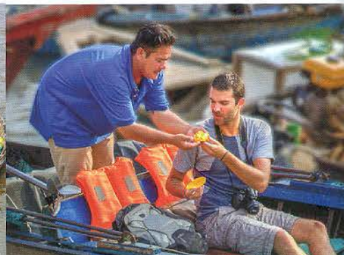
Du khách thưởng thức trái cây tại chợ nổi.