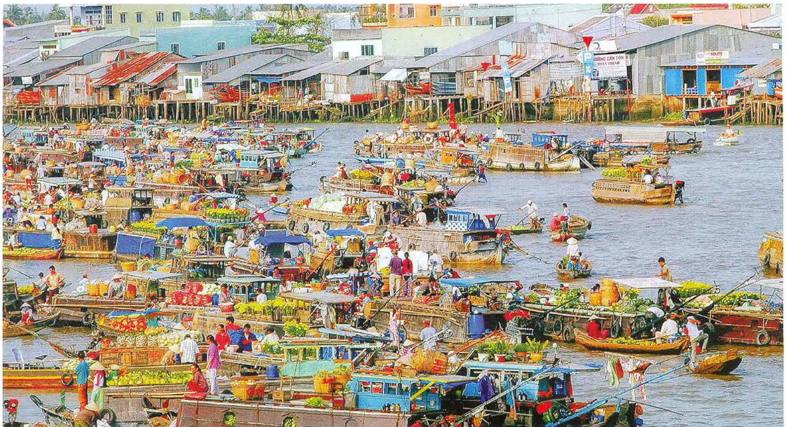
Tập nập chợ nổi Cái Răng. Ảnh: Thanh Hiền

Với những giá trị đặc sắc về văn hóa và kinh tế, chợ nổi Cái Răng đã được Tạp chí Du lịch Rough Guide (Anh) bình chọn là một trong 10 khu chợ ấn tượng nhất thế giới, mô tả là điểm đặc biệt lạ mắt với các thuyền bán hàng “rực rỡ sắc màu nhiệt đới”. Trang web youramazingplaces cũng đưa ra danh sách 6 chợ nổi đẹp nhất châu Á, trong đó có đề cập đến chợ nổi của khu vực đồng bằng sông Cửu Long (ĐBSCL), mà chợ nổi Cái Răng là một điển hình. Tạp chí Lonely Planet Traveller đã ca ngợi: “ĐBSCL là nơi trải nghiệm cuộc sống sông nước - với chợ nổi Cái Bè, chợ nổi Cái Răng, nơi ghe thuyền tấp nập mua bán, với ký hiệu từ cây sào treo mặt hàng cần bán, với các con thuyền chuyên chở cả nhà hàng ẩm thực xuôi ngược, với âm thanh nhộn nhịp hòa lẫn giọng ca vọng cổ nào nùng...”. Chợ nổi Cái Răng được Bộ Văn hóa, Thể thao và Du lịch công nhận là Di sản Văn hóa phi vật thể quốc gia năm 2016.