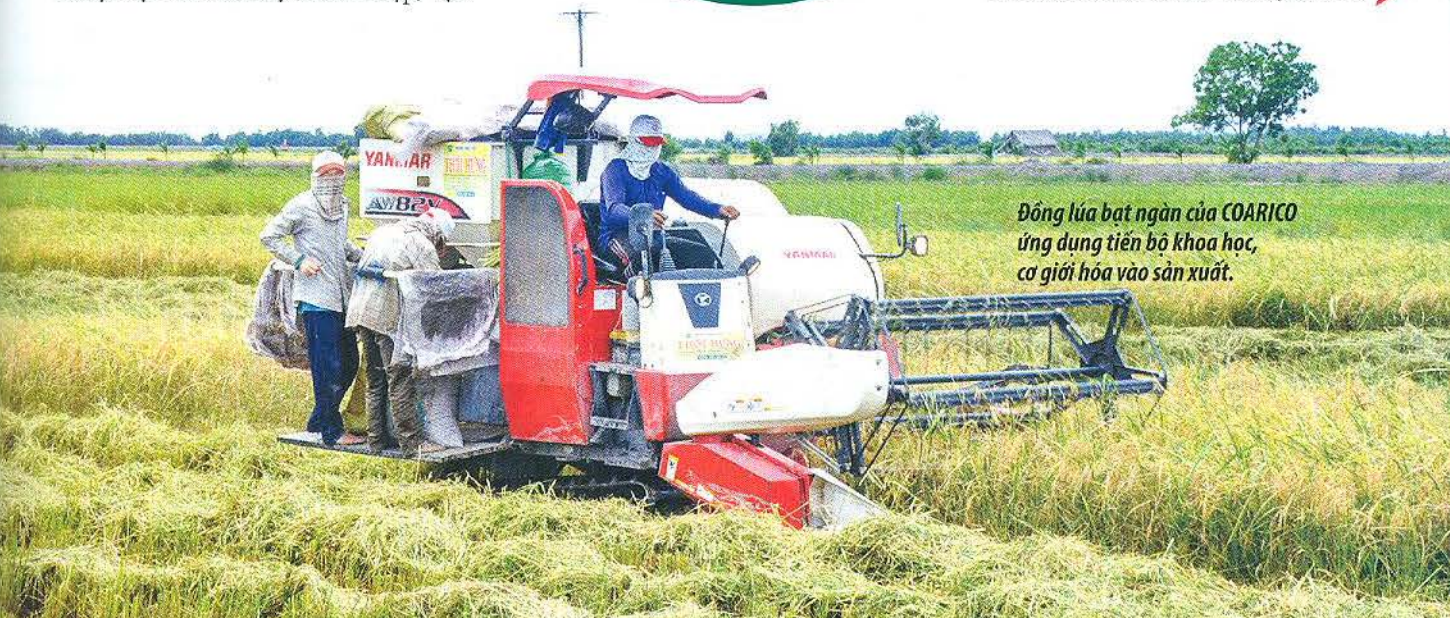
Đồn lúa bạt ngàn của COARICO ứng dụng tiến bộ khoa học, cơ giới hóa vào sản xuất.

COARICO thực hiện chính sách thu khoán nông dân theo hợp đồng 200 kg lúa/ha/năm. Nông dân được công ty hỗ trợ vốn vay sản xuất và cung ứng dịch vụ vật tư nông nghiệp, lúa giống, sấy lúa... đều thấp hơn so với giá thị trường 10-15%. Cuối vụ công ty thu mua theo giá thị trường tại 3 hệ thống kho tàng sức chứa 30.000 tấn và 63 lò sấy công suất 700-800 tấn/ngày.