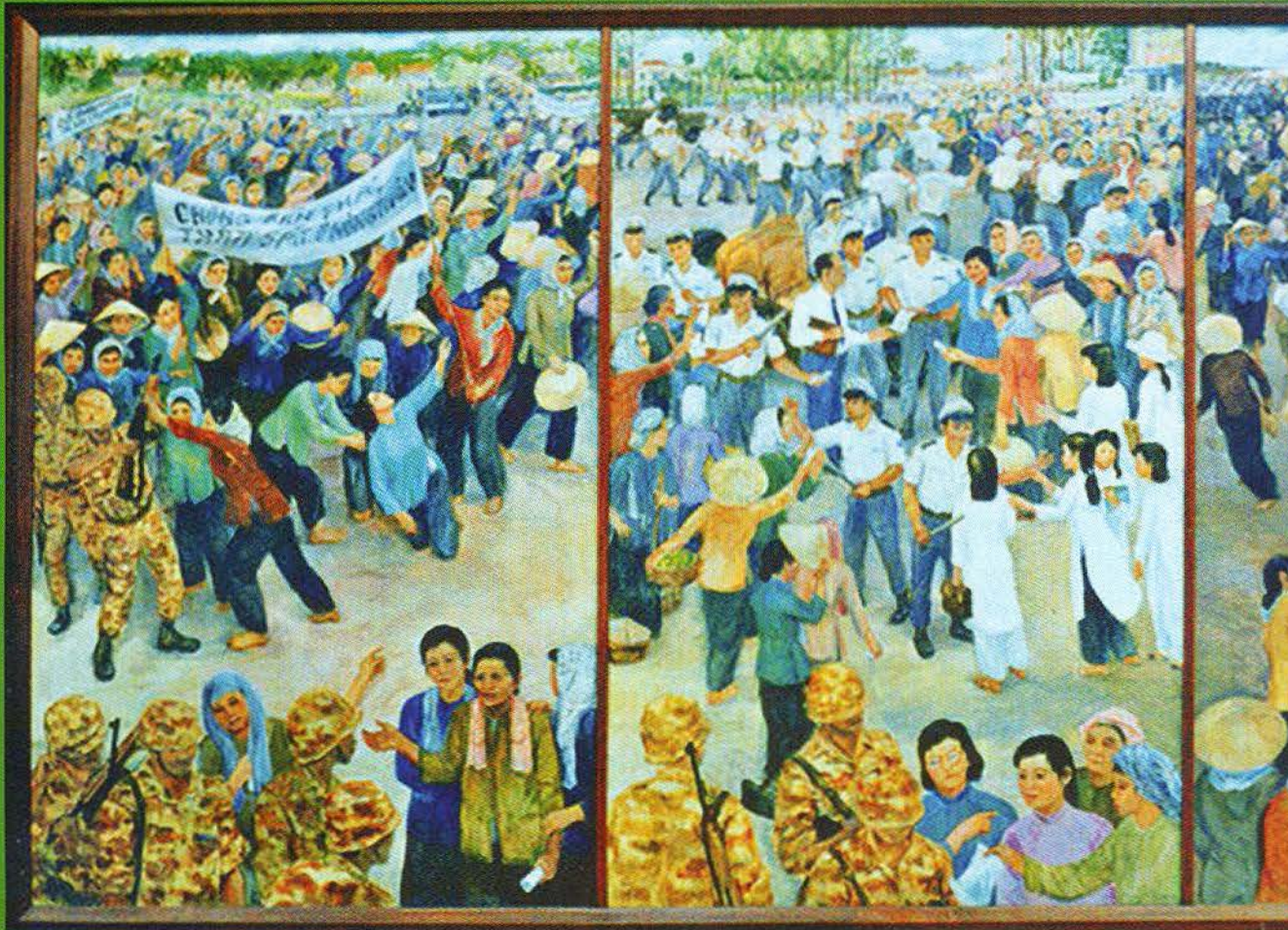
Đội quân tóc dài - Đô thị Cần Thơ năm 1970. Tranh: TÔ DỤ

→ Các cấp Hội trong Tỉnh đã huy động lực lượng chính trị, binh vận hàng trăm ngàn lượt chị em theo các tuyến sông rạch, ven thị xã, thị trấn chuẩn bị chờ lệnh tiến vào thị xã, thị trấn. Trong tuyến Vòng Cung Cần Thơ có trên 3.000 nữ tấn công hòa tuyến. Ở hậu phương có trên 7.000 chị em tham gia xây dựng xã ấp chiến đấu, đào 20.000 hầm chông, vót 2,5 triệu mũi chông, đào 15.000 m chiến hào. Ở tuyến lửa Vòng Cung, nhiều nữ thanh niên đã bám trụ chiến đấu rất kiên cường, nhiều chị đã hy sinh anh dũng. Phong trào tiến chông, con ra phía trước diễn ra rất rầm rộ. Mặt khác, chị em còn đảm nhận công việc đồng án khi vụ lúa đang chín vàng đồng để thay chông, con an tâm ra phía trước. Những nơi địch đánh phá nhiều, chị em lấy ngày làm đêm, sản xuất dưới bom đạn.