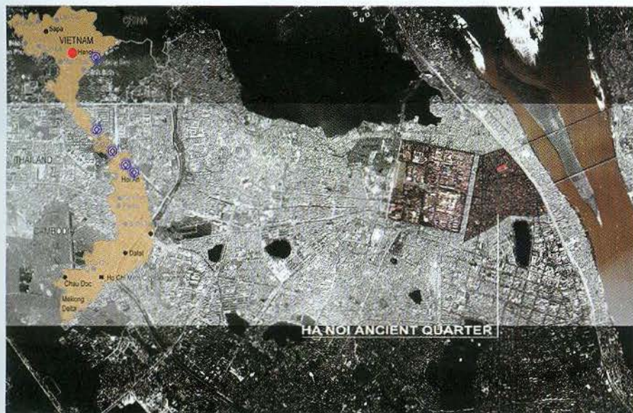
Bản đồ thể hiện vị trí KPC Hà Nội

Tiếp theo (năm 2000), Hà Nội triển khai việc giải phóng mặt bằng tại 38 phố Hàng Đào để TP Toulouse hỗ trợ trùng tu đình Đồng Lạc. Thành phố đầu tư lớn để cải tạo toàn bộ hồ xí thùng trong KPC, cấp điện, cấp nước, viễn thông được cải tạo, nâng cấp (1998-2000). Dân cư KPC đóng góp 50% để cải thiện nhà vệ sinh gia đình.