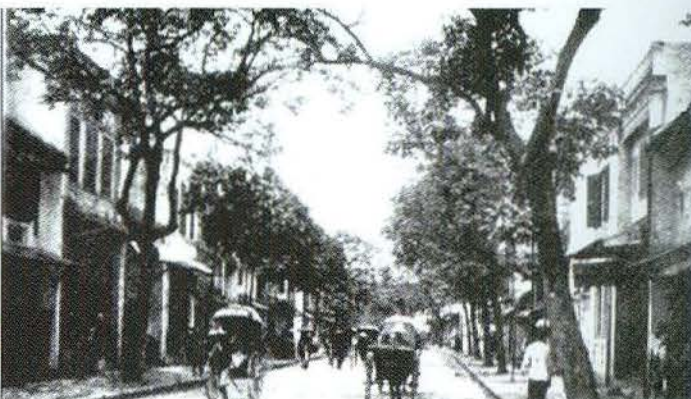
Hình ảnh KPC Hà Nội những năm đầu thế kỷ 20