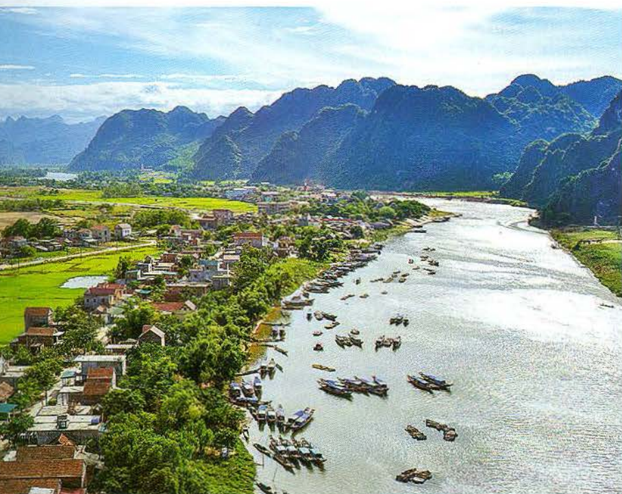
Trên sông sông Sơn. Ảnh: Nguyễn Trung Hoa

Nằm giữa lòng Di sản Thiên nhiên thế giới Vườn quốc gia Phong Nha - Kẻ Bàng, xã Sơn Trạch (huyện Bố Trạch, tỉnh Quảng Bình) là điểm đến của nhiều du khách trong nước và quốc tế. Khi đến trung tâm của xã miền núi này, chắc hẳn bạn sẽ ấn tượng với những nhà hàng, quán cafe, quán ăn... được thiết kế độc đáo với khung cảnh yên bình, hài hòa mang đậm nét làng quê Việt Nam. Sau cuộc hành trình dài khám phá hang động, tìm hiểu mảnh đất, con người, văn hóa nơi đây, bạn có thể nghỉ chân thư giãn trong không gian mộc mạc, yên bình được trang trí bằng những khóm trúc, bụi chuối, những sản phẩm từ chất liệu tre và thưởng thức những