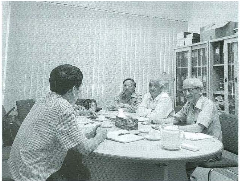
GS. Phan Huy Lê làm việc với Ban chủ nhiệm Đề án bộ Quốc sử Việt Nam

Là vị Tổng tư lệnh chỉ đạo bao quát chung tất cả các tập, các lĩnh vực, nhưng GS. Phan Huy Lê lại là người đi tiên phong, làm mẫu cho mỗi công đoạn, công việc cụ thể. Chẳng hạn như kế hoạch viết mẫu các chương, hay việc hoàn thành bản thảo sơ bộ các tập và hội thảo rút kinh nghiệm của các tập, ông đều hoàn thành trước nhất để rút kinh nghiệm cho những người đi sau và cho cả chính mình. Ông lãnh đạo Đề án bằng tám gương ngời sáng trong việc thực hiện đầy đủ, triệt để các quy định và Thế lệ biên soạn bộ Lịch sử Việt Nam . Trong nghiên cứu, biên soạn lịch sử, ông tuyệt đối tuân thủ nguyên tắc bất di bất dịch của sử học là phải thẳng thắn, trung thực tôn trọng sự thật lịch sử khách quan. Ông chỉ đạo cho các tác giả và những người có