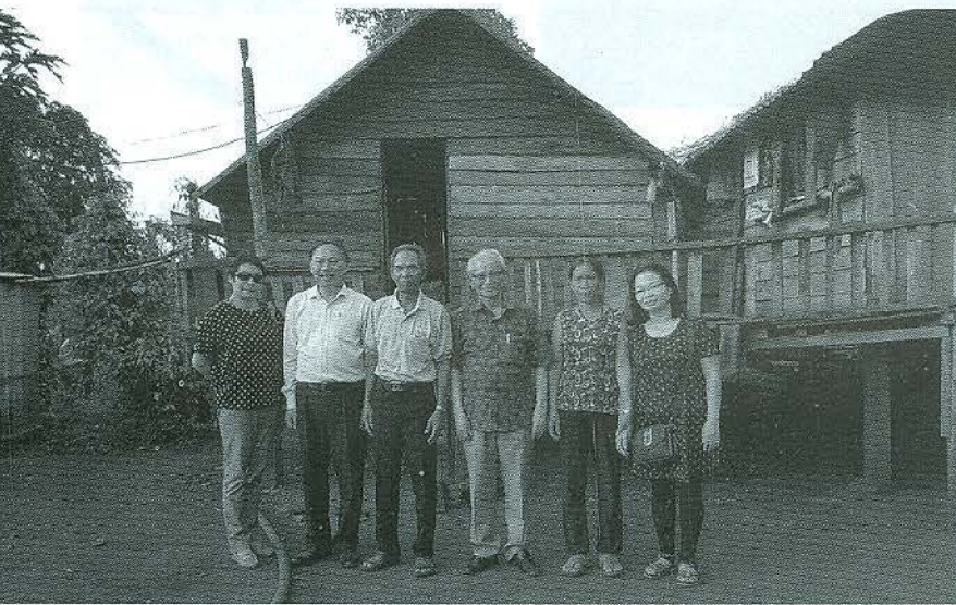
GS. Phan Huy Lê (người thứ 3 từ phải sang) khảo sát địa bàn của Yang Potao Apui (Thần Vua Lửa) và Yang Potao Ia (Thần Vua Nước) tại Gia Lai tháng 10-2016.

Tôi cũng đã có gần 50 năm theo GS. Phan Huy Lê đi khắp mọi miền đất nước và nhiều nước phương Đông, phương Tây, cả những lúc yên bình và trong những trận chiến sinh tử vì sự thật lịch sử và di sản của tổ tông, nhưng chưa bao giờ tôi thấy Giáo sư mạnh mẽ và quyết liệt như những tháng năm chỉ đạo biên soạn Quốc sử. Sau khi tập trung hoàn thành Đề cương chi tiết của các tập GS. Phan Huy Lê thúc đẩy phải xây dựng cho bằng được Thể lệ biên soạn bộ Lịch sử Việt Nam . Thể lệ biên soạn phải nêu lên được “những nguyên tắc chung và những quy định cụ thể để mỗi tập thấy rõ vị trí của mình trong tổng thể công trình và yêu cầu thống nhất trong nhận thức cũng như trong nghiên cứu và trình bày. Có như thế, 30 Ban Biên soạn mới có thể đồng hành trên quỹ đạo chung và 30 tập sách mới có thể là những bộ phận của một công trình khoa học thống nhất”. Thể lệ biên soạn không chỉ quy định các quan điểm cơ bản, các nguyên tắc biên soạn chung, mà còn đi sâu vào các yêu cầu hết sức cụ thể như trình bày sự kiện, dẫn sách và các quy định chính tả. GS. Phan Huy Lê luôn luôn nhấn mạnh Bộ Quốc sử 30 tập “là một công trình khoa học hoàn toàn mới với những yêu cầu mới cả về nội dung, hình thức và chất