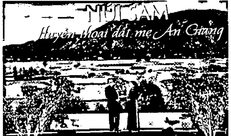
Đại diện Bộ VH, TT&DL trao Quyết định của Thủ tướng Chính phủ cho lãnh đạo tỉnh An Giang.

TỐI 8-6, TẠI TRUNG TÂM THƯƠNG MẠI VINH ĐÔNG (PHƯỜNG NÚI SÂM, TP. CHÂU ĐỐC), UBND TỈNH LONG TRỌNG TỔ CHỨC LỄ CÔNG BỐ QUYẾT ĐỊNH CỦA THỦ TƯỚNG CHÍNH PHỦ PHÊ DUYỆT QUY HOẠCH TỔNG THỂ PHÁT TRIỂN KHU DU LỊCH QUỐC GIA (DLQG) NÚI SÂM, TỈNH AN GIANG ĐẾN NĂM 2025, TẦM NHÌN ĐẾN NĂM 2030.