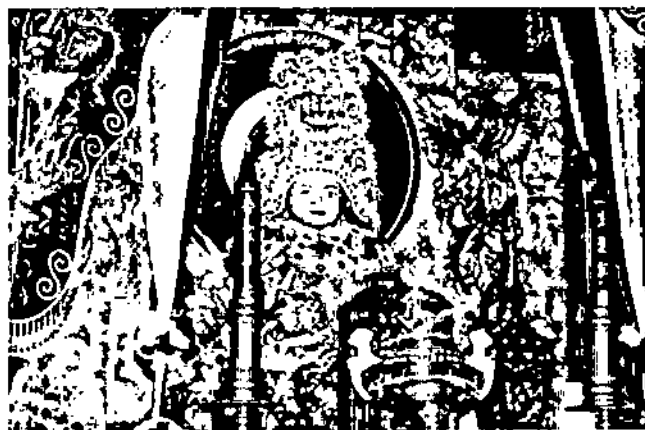
Bà Chúa xứ núi Sam trở thành biểu tượng văn hóa tâm linh của người dân An Giang và Nam Bộ.

Việc đầu tư xây dựng, quản lý đầu tư xây dựng trong phạm vi Khu DLQG Núi Sam tuân thủ theo quy định của pháp luật về xây dựng, quy hoạch xây dựng