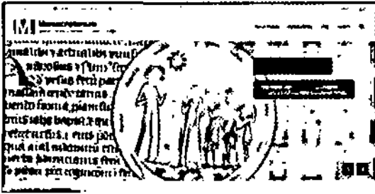
Hình 1: Trang chủ Manuscriptorium

và xem lướt mục lục bằng cách nhấp chuột vào phần "Library" trên thanh định vị. Nếu muốn lưu lịch sử tìm kiếm, nhận diện các tài liệu ưa thích, tạo lập các tài liệu số hoặc bộ sưu tập theo yêu cầu, người dùng phải có một tài khoản đăng ký. Việc đăng ký tài khoản là hoàn toàn miễn phí với thủ tục nhanh gọn và thuận tiện (chưa đầy 5 phút thao tác).