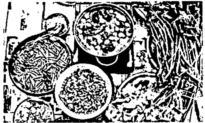
Lẩu mắm cá linh

Với những cái tên nghe rất lạ như gỏi sấu đầu khô cá lóc, tung lò mò, xôi xiêm, cơm nị cà pú khiến ẩm thực Châu Đốc không chỉ mang lại cho thực khách một cảm giác khá tò mò, mà còn làm cho hành trình khám phá thêm thú vị hơn rất nhiều. Những cái tên