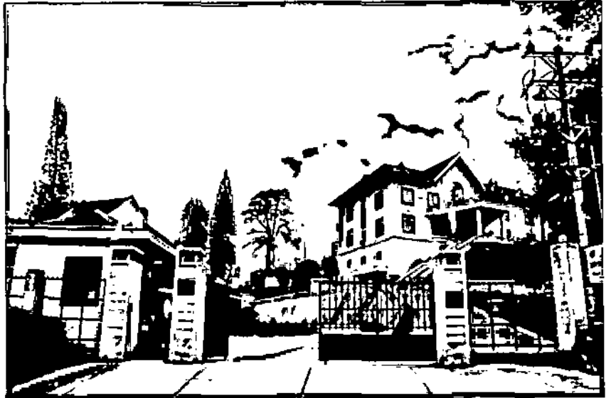
Biệt điện Trần Lệ Xuân (hay biệt điện bà cố vấn)