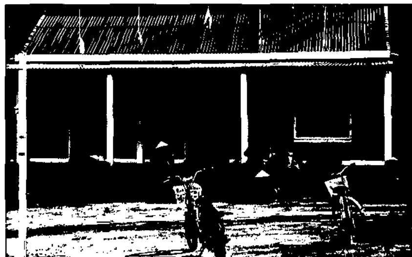
Sau bão, người dân thôn Tam Đa (xã Quảng Lưu) dọn dẹp vệ sinh Nhà văn hóa thôn để tổ chức các hoạt động cộng đồng.

Có thể nói, nhờ sự chủ động của người dân và sự giúp đỡ tích cực của các lực lượng bộ đội biên phòng, công an mà nhiều thiết chế văn hóa - thể thao ở Quảng Trạch bị thiệt hại nặng nề do sức tàn phá của cơn bão số 10 trong năm nay đã hoạt động trở lại. Dẫu vậy, nhiều địa phương ở huyện Quảng Trạch vẫn đang gặp khó khăn về kinh phí nên công tác khắc phục các thiết chế văn hóa không phải không có những vướng mắc. Theo lời ông Nguyễn Trần Sơn, Phó trưởng Phòng Văn hóa - Thông tin huyện Quảng Trạch thì trước mắt cần vận động người dân ở các xã cũng như trong toàn huyện cùng chung tay quyên góp, ủng hộ để mua sắm lại các thiết chế văn hóa, thể thao bị hư hỏng, đáp ứng nhu cầu vui chơi, giải trí, hưởng thụ văn hóa, thể thao của các tầng lớp nhân dân. □