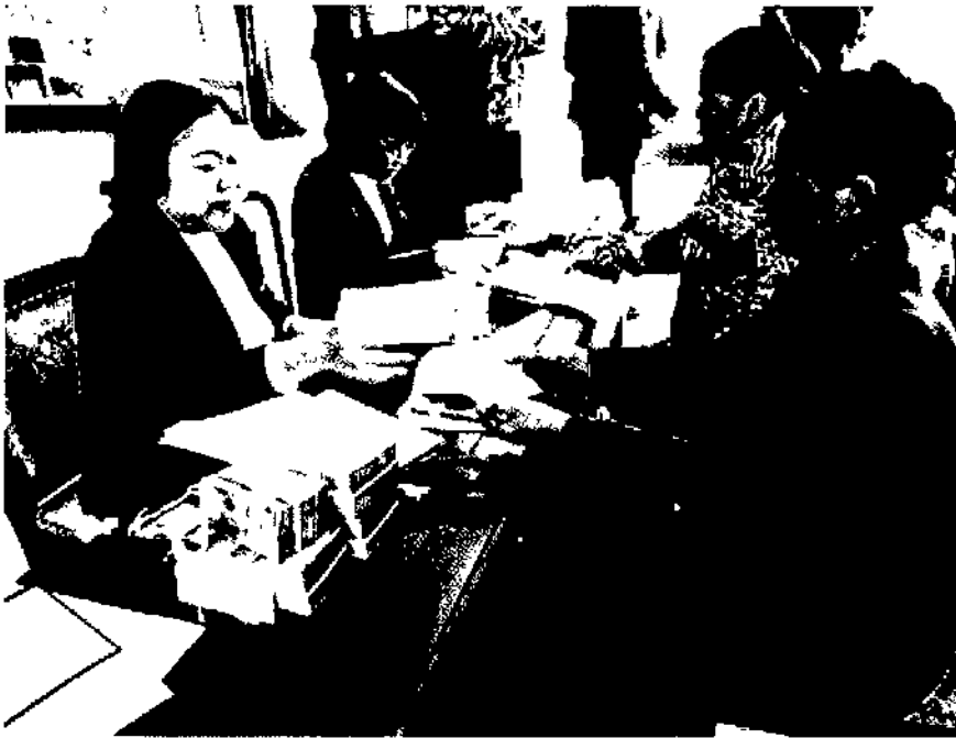
Dư nợ nông nghiệp, nông thôn tại khu vực Đồng bằng sông Cửu Long chiếm tỷ trọng trên 90% tổng dư nợ của Agribank

cho các làng nghề, tạo việc làm cho người dân; tạo cơ hội xuất khẩu sản phẩm thủ công truyền thống; tạo cơ hội giao lưu văn hóa bản địa và văn hóa của khách du lịch nước ngoài; góp phần chuyển dịch cơ cấu kinh tế ở nông thôn, chuyển dịch lao động nông nghiệp sang lĩnh vực dịch vụ; kích thích phát triển cơ sở hạ tầng thông qua hoạt động du lịch; bảo tồn các giá trị văn hóa truyền thống quý báu của làng nghề.