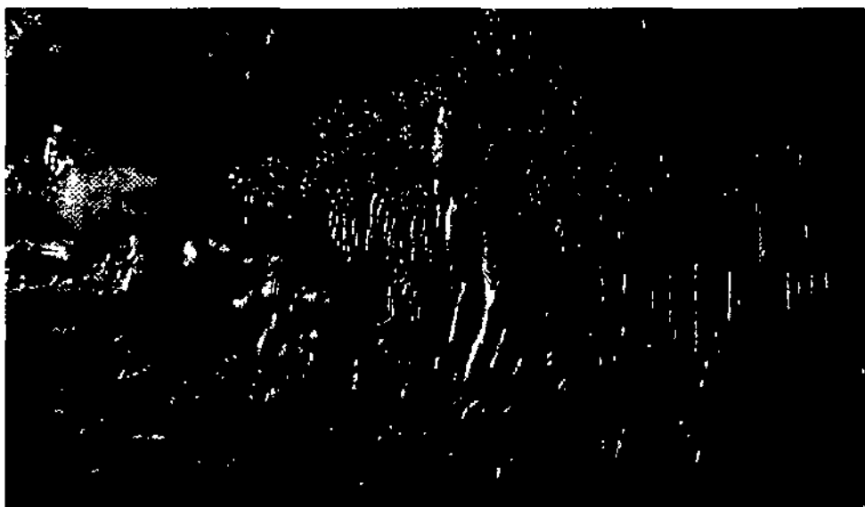
Sản phẩm tinh xảo của làng chạm bạc Đồng Xâm

Nếu Hà Nội có làng kim hoàn Định Công thì khi nhắc đến Thái Bình, người ta không thể không nhắc đến làng nghề chạm bạc Đồng Xâm. Với bí quyết được gìn giữ trong suốt 4 thế kỷ qua, danh tiếng của những sản phẩm tuyệt mỹ, tinh xảo mà nghệ nhân làng Đồng Xâm làm đã vượt ra khỏi biên giới quốc gia, tới nhiều nơi trên thế giới.