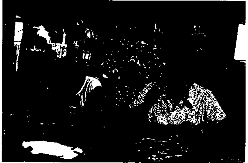
Người thợ ở làng Đồng Xâm luôn tỉ mỉ trong từng sản phẩm

Công đoạn tiếp theo là dùng bễ xi lửa để tách sản phẩm khỏi khuôn, rồi mạ bạc cho sáng màu và bắt mắt. Hàng chạm bạc Đồng Xâm có sự chau chuốt, thể hiện sự chuyên nghiệp rõ từ hình khối cân đối, dáng vẻ thanh thoát, điệu nghệ trong từng sản phẩm. Để có được những sản phẩm tinh xảo, vừa lấp lánh ánh kim, vừa mềm mại, tinh tế trong từng đường nét, hoa văn đòi hỏi phải đạt tới trình độ điêu luyện. Chính những đôi bàn tay vàng tỉ mỉ của những người thợ Đồng Xâm đã thổi hồn vào sản phẩm chạm bạc. Thương hiệu của làng nghề cũng nhờ vậy mà có