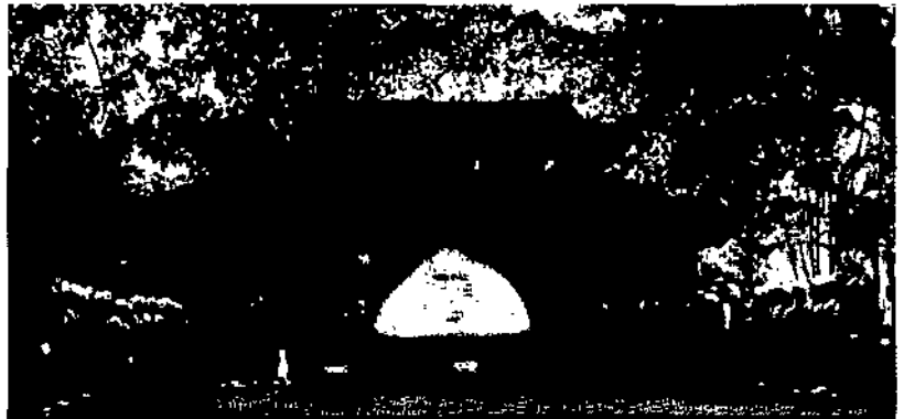
Lời hiệu triệu của Hồ Chủ tịch trong ngày thương binh và tử sĩ 27/7/1947 và Khu di tích lịch sử tại Xóm Bàn Cờ, Xã Hùng Sơn, huyện Đại Từ, Thái Nguyên - Địa điểm công bố bức thư lấy ngày 27/7 là ngày Thương binh toàn quốc

“Uống nước nhớ nguồn, ăn quả nhớ người trồng cây” là truyền thống quý báu của dân tộc Việt Nam.