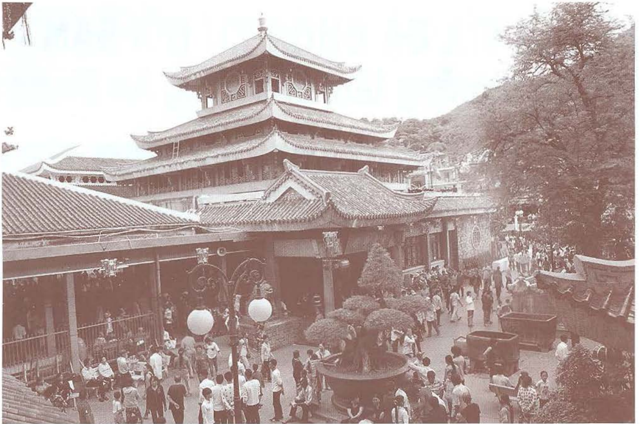
Du khách thập phương tới tham gia lễ rước, cúng Bà

Cầu tất ứng, thí tất linh, mộng trung chi thị