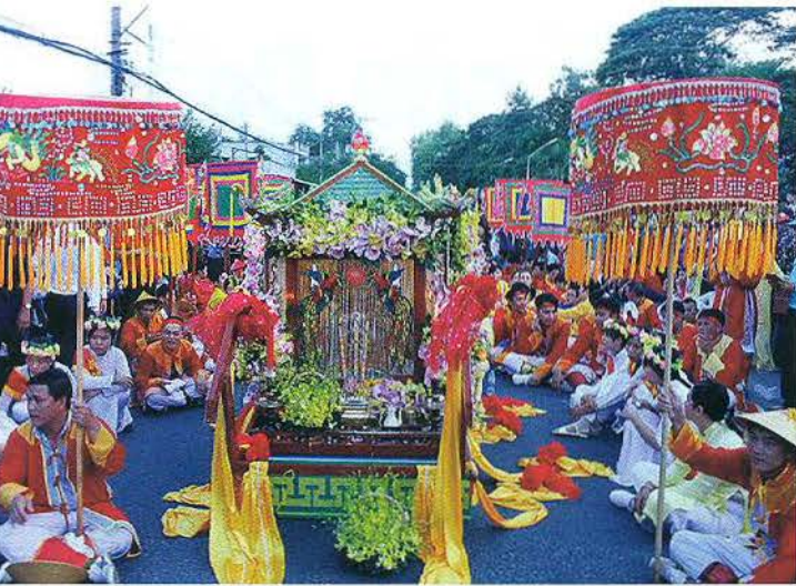
Lễ rước tượng Bà