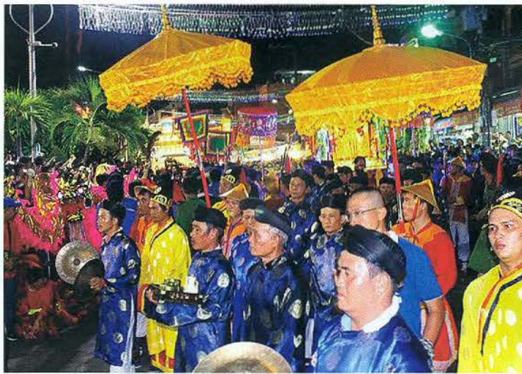
Hàng ngàn người thập tùng cùng đoàn rước tượng Bà