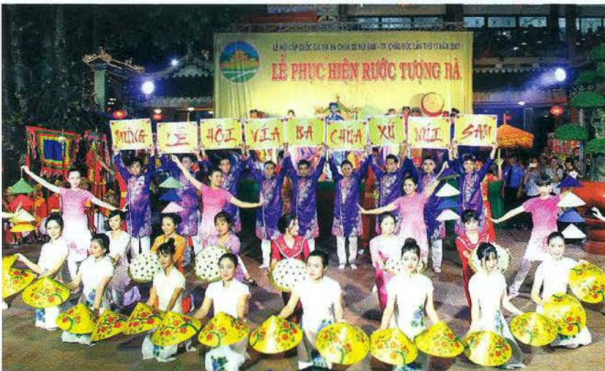
Lễ phục hiện rước tượng Bà Chúa Xứ Núi Sam 2017

thành, ông cho khắc bia “Châu Đốc Tân Lộ Kiều Lương” dựng tại núi Sam năm 1828 để kỷ niệm. Ngày nay, tấm bia không còn nhưng còn văn bia trong sử sách. Các bộ lão trong làng và Ban quản trị miếu mặc lễ phục chỉnh tề sang làng Thoại Ngọc Hầu làm Lễ thỉnh sắc rước bài vị của Ngọc Hầu Nguyễn Văn Thoại để tỏ lòng biết ơn người có công khai phá vùng đất hoang vu này.