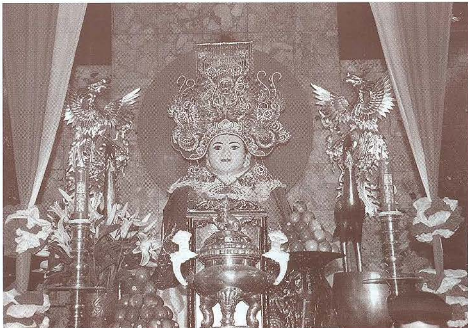
Tượng Bà Chúa Xứ núi Sam

Lễ hội Vía Bà Chúa Xứ núi Sam được tổ chức vào cuối tháng 4 âm lịch hằng năm thu hút hàng triệu lượt người đến tham quan, chiêm bái, tạo nên một mùa lễ hội nhộn nhịp, sôi động tại miếu Bà Chúa Xứ, thị trấn Châu Đốc, tỉnh An Giang.