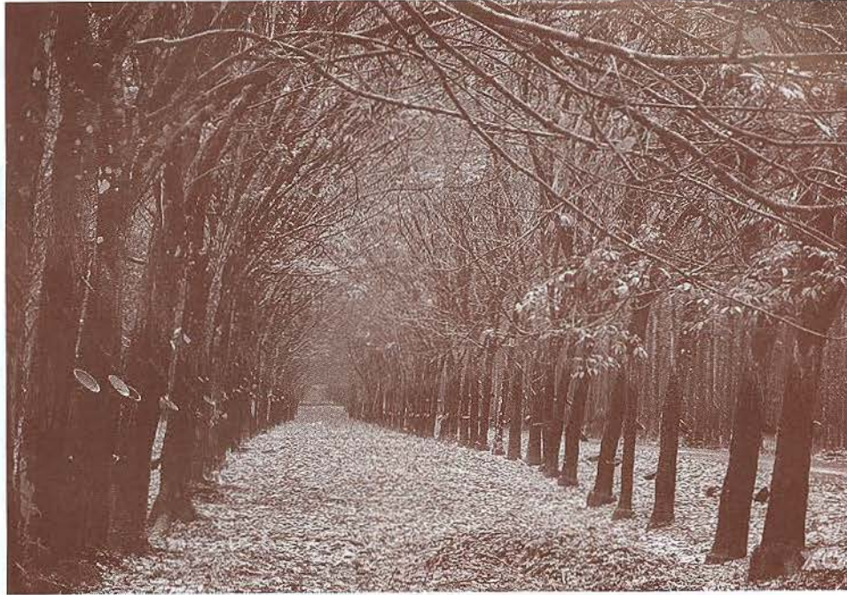
Khung cảnh lãng mạn của rừng cao su mùa thay lá

Nếu không có nhiều thời gian và không đủ sức khỏe để trải nghiệm cảm giác băng rừng vượt suối, bạn có thể dừng lại ở núi Bà Rá - một ngọn núi nằm cô lẻ giữa miền đất bằng phẳng, tạo nên cảnh quang hết sức hữu tình. Từ khi hệ thống cáp treo lên núi Cà Rá được xây dựng thì ngày càng có nhiều du khách đến đây để được ngắm nhìn toàn cảnh tuyệt đẹp bên dưới, ngắm Thị trấn Thác Mơ dịu dàng thơ mộng và Hồ Thác Mơ êm đềm những ngày nắng, tung bọt trắng xóa những ngày