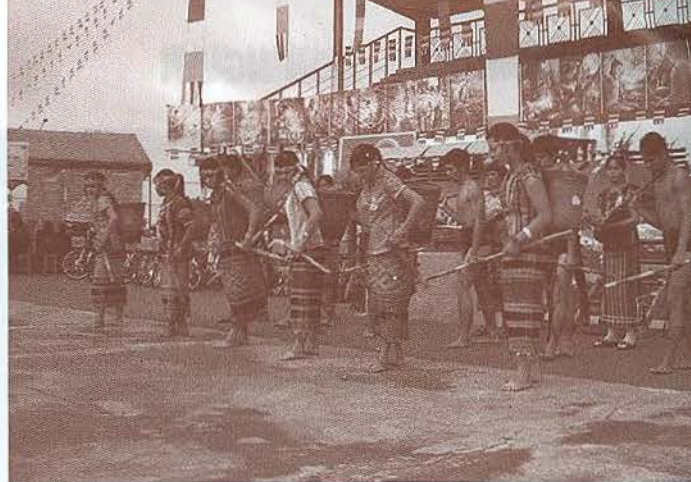
Đời sống văn hoá của Bom Bo vẫn rất đặc sắc