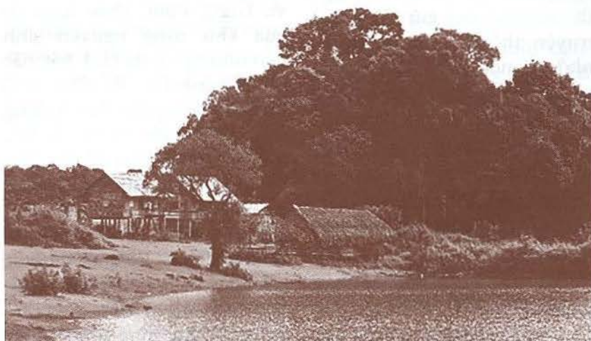
Những ngôi nhà sàn của người M'Nông quanh trảng cỏ Bù Lạch

Năm 1965, Bộ Tư lệnh Miền quyết định mở chiến dịch Đồng Xoài - Phước Long nhằm tiêu diệt cụm quân sự của địch ở phía bắc chiến khu Đ, trong phạm vi tỉnh Phước Long, Bình Long và trên trục giao thông chiến lược Tây Nguyên - Sài Gòn. Thời điểm này, Sóc Bom Bo trở thành trung tâm tiếp tế lương thực cho bộ đội tham gia chiến dịch. Tất cả mọi người dù là già, trẻ, gái trai đều nô nức lao động nuôi quân, ban ngày lên nương trồng lúa, trồng mì, tối về đốt đuốc giã gạo cho đến