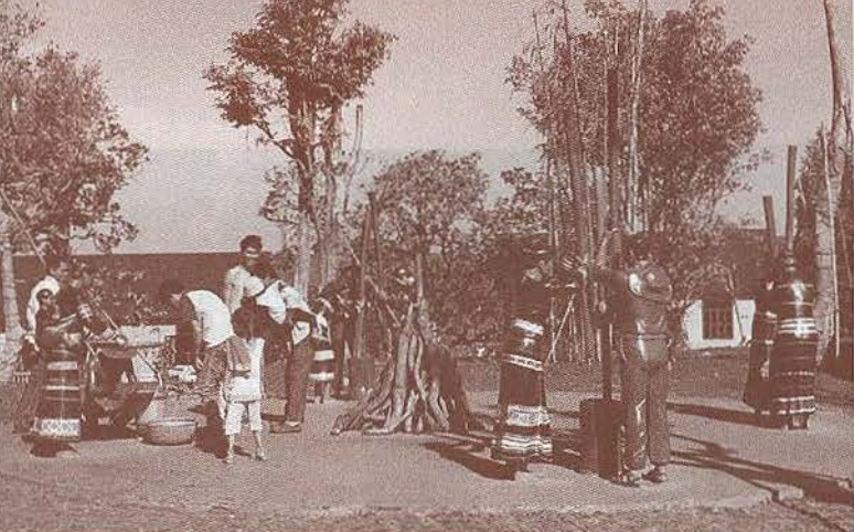
Tái hiện hình ảnh người dân S'tiêng giã gạo nuôi quân