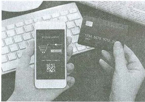
ANH: QUẢN TRƯỞNG

Về cơ sở hạ tầng, công nghệ, năm 2015 NHNN đã ban hành Kế hoạch số 16 về chuyển đổi thẻ ngân hàng từ thẻ từ sang thẻ gắn vi mạch điện tử.