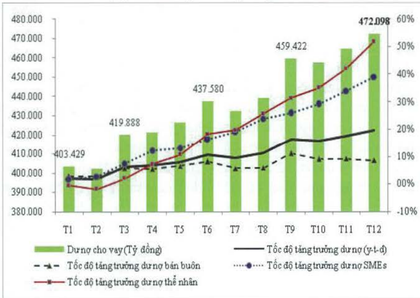
Biểu đồ 3: Diễn biến tăng trưởng tín dụng của Vietcombank của một số nhóm đối tượng khách hàng các tháng trong năm 2016