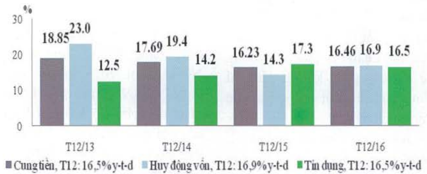
Biểu đồ 1: Diễn biến một số chỉ tiêu chủ yếu hoạt động ngân hàng năm 2016