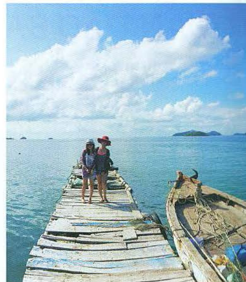
Du khách tận hưởng nắng gió giữa biển trời mênh mông

hoặc cùng ngư dân lặn biển ngắm san hô, đây thực sự là một hoạt động thú vị bạn không nên bỏ qua. Hòa mình vào thiên nhiên, nhìn màu xanh của nước, tận hưởng nắng gió trên biển sẽ khiến bạn cảm thấy thư thái và yên bình vô cùng.