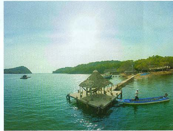
Phong cảnh hoang sơ của quần đảo Bà Lụa

Quần đảo Bà Lụa (còn có tên là Bình Trị) nằm ở ngoài khơi vùng biển thuộc huyện Kiên Lương, tỉnh Kiên Giang, ở vị trí cách mũi Hòn Chông - Bình An khoảng 7km về phía Tây và cách Ngã Ba Hòn 15km về hướng Đông. Là địa danh còn khá hoang sơ, lại nằm trong vùng biển ít có gió to, sóng lớn nên được nhiều du khách nhất là những bạn trẻ thích phượt tìm đến để khám phá, trải nghiệm.