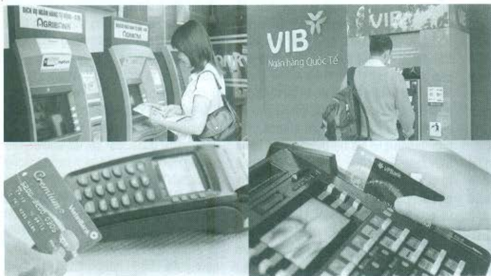
Các ngân hàng cũng ngày càng quan tâm, chú trọng nhiều hơn đến việc tăng cường đầu tư, trang bị cả về số lượng cũng như chất lượng máy ATM, POS