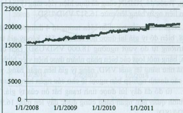
Hình 1. Tỷ giá VND/USD giai đoạn 2008 - 2011

Dưới tác động của khủng hoảng tài chính Hoa Kỳ và khủng hoảng nợ công châu Âu, tỷ giá VND/USD được cho là đã thay đổi tới 25,3% trong giai đoạn 2009 - 2011. Đến cuối năm 2011, 1 USD = 21.000 VND, trong khi trước đó chỉ khoảng hơn 16.660 VND.