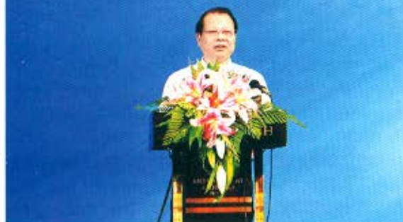
Phó Thủ tướng Vũ Văn Ninh phát biểu chỉ đạo tại Hội nghị xúc tiến đầu tư vào lĩnh vực du lịch xanh vùng ĐBSCL.

Xây dựng và phát triển thành phố Cần Thơ văn minh, hiện đại, tất yếu sẽ dẫn đến việc đô thị hóa diễn ra nhanh chóng. Quá trình này làm cho diện tích đất sản xuất nông nghiệp sẽ giảm dần; các ngành, lĩnh vực thương mại, dịch vụ, công nghiệp phát triển lan tỏa trên khắp địa bàn sẽ tác động sâu sắc đến diện mạo nông nghiệp, nông thôn và đời sống của nông dân thành phố Cần Thơ. Để đáp ứng yêu cầu nâng cao chất lượng, giá trị gia tăng, sức cạnh tranh các sản phẩm nông nghiệp, đòi hỏi phải ứng dụng tiên bộ khoa học và công nghệ, nhất là công nghệ sinh học và gắn kết chặt chẽ giữa phát triển kinh tế nông nghiệp với các ngành, lĩnh vực kinh tế khác. Trong đó, việc gắn kết giữa phát triển kinh tế nông nghiệp với du lịch văn hóa đã được Đại hội đại biểu Đảng bộ thành phố Cần Thơ lần thứ XIII, nhiệm kỳ 2015 - 2020 xác định là một trong những giải pháp trong chuyển dịch cơ cấu kinh tế theo hướng dịch vụ - công nghiệp - nông nghiệp công nghệ cao.