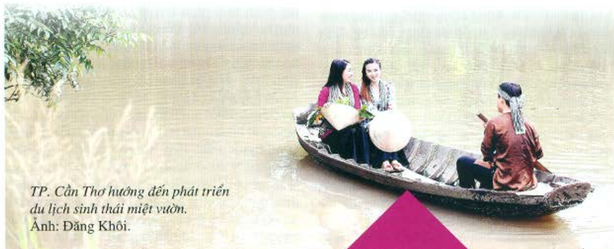
TP. Cần Thơ hướng đến phát triển du lịch sinh thái miệt vườn.

Xây dựng và phát triển thành phố Cần Thơ văn minh, hiện đại, tất yếu sẽ dẫn đến việc đô thị hóa diễn ra nhanh chóng. Quá trình này làm cho diện tích đất sản xuất nông nghiệp sẽ giảm dần; các ngành, lĩnh vực thương mại, dịch vụ, công nghiệp phát triển lan tỏa trên khắp địa bàn sẽ tác động sâu sắc đến diện mạo nông nghiệp, nông thôn và đời sống của nông dân thành phố Cần Thơ. Để đáp ứng yêu cầu nâng cao chất lượng, giá trị gia tăng, sức cạnh tranh các sản phẩm nông nghiệp, đòi hỏi phải ứng dụng tiên bộ khoa học và công nghệ, nhất là công nghệ sinh học và gắn kết chặt chẽ giữa phát triển kinh tế nông nghiệp với các ngành, lĩnh vực kinh tế khác. Trong đó, việc gắn kết giữa phát triển kinh tế nông nghiệp với du lịch văn hóa đã được Đại hội đại biểu Đảng bộ thành phố Cần Thơ lần thứ XIII, nhiệm kỳ 2015 - 2020 xác định là một trong những giải pháp trong chuyển dịch cơ cấu kinh tế theo hướng dịch vụ - công nghiệp - nông nghiệp công nghệ cao.