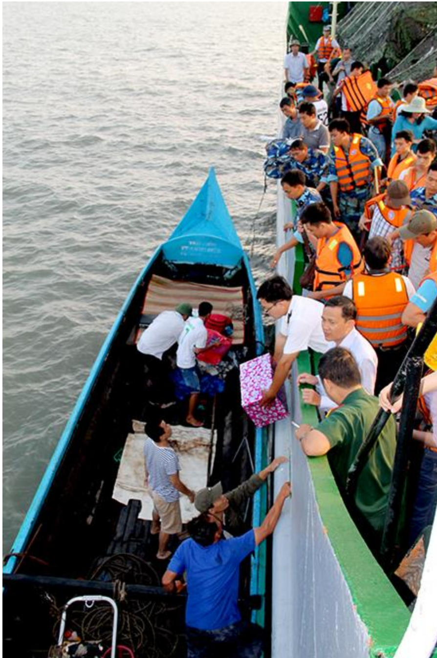
Chuyển quà từ tàu HQ-637 xuống tàu trung chuyển để vào đảo Hòn Khoai.