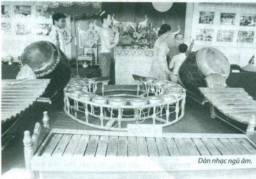
Đàn nhạc ngũ âm.

Có khá nhiều tư liệu mô tả hình dáng, cấu trúc, kỹ thuật sử dụng giàn nhạc ngũ âm. Theo tác giả Kim Phương (Trung tâm TTXSDL tỉnh Sóc Trăng): Hai dàn cồng Cuông-tuôch và Cuông-thôm được làm bằng chất liệu đồng, mỗi cái gồm có 16 cái cồng nhỏ có núm, được kết lại với nhau tạo thành vòng có hình bán nguyệt. Khi diễn tấu, nhạc công sẽ ngồi bên trong vòng cong đó, dùng 2 dùi để gõ. Tùy theo độ lớn, nhỏ, dày, mỏng của từng quả mà phát ra âm thanh khác nhau.