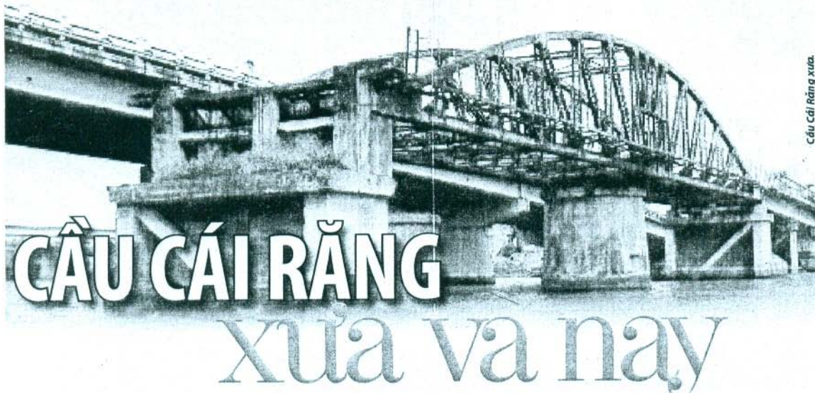
Cầu Cái Răng xưa.

N gày trước, khi chưa có cầu Quang Trung, cầu Hưng Lợi và đường dẫn cầu Cần Thơ, khách bộ hành, xe cộ từ các tỉnh miền Hậu Giang, Sóc Trăng, Bạc Liêu, Cà Mau muốn vào Cần Thơ, hoặc đi TP Hồ Chí Minh đều phải qua cầu Cái Răng, cửa ngõ phía Nam của thành phố. Ngày nay, đi qua cầu Cái Răng vừa được xây mới, không khỏi nhớ đến chiếc cầu đã từng đóng hành cùng những thăng trầm lịch sử.