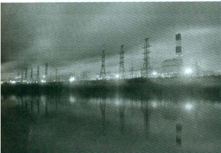
Trung tâm điện lực Ô Môn

Mười năm sau khi đã trở thành thành phố cấp quốc gia, TPCT đã có một bước tiến dài để trở thành một thành phố công nghiệp trẻ, một đô thị nông nghiệp chất lượng cao, một trung tâm thương mại dịch vụ và du lịch của vùng đồng bằng. Con đường phía trước còn dài và cũng không ít thách thức. Nhưng với quyết tâm của Đảng bộ và nhân dân Cần Thơ, bằng bản lĩnh và kinh nghiệm của mười năm nỗ lực phấn đấu với những thành tựu như hiện giờ, tin rằng thành phố Cần Thơ sẽ còn tiếp tục phát triển bền vững để tiến mạnh, tiến xa hơn.