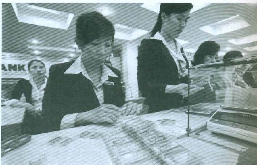
Qua hơn 8 tháng thực hiện mua bán vàng miếng qua mạng lưới mới, có thể thấy hoạt động mua bán vàng miếng trên thị trường diễn ra thông suốt, ổn định, quyền lợi hợp pháp của người dân được đảm bảo và bảo vệ

Trải qua một quá trình khó khăn, phức tạp, việc triển khai Nghị định 24/2012/NĐ-CP ngày 03/4/2012 của Chính phủ về quản lý thị trường vàng đã thu được những kết quả bước đầu rất tích cực, góp phần quan trọng ổn định kinh tế vĩ mô, kiểm soát lạm phát. Trong đó, việc chấm dứt huy động, cho vay vốn bằng vàng của các TCTD về cơ bản đã kết thúc và mang lại