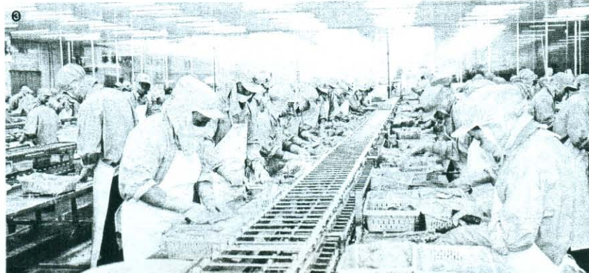
1/ - Một góc Khu công nghiệp Trà Nóc. 2/ - Công nhân Công ty TNHH May Xuất khẩu Việt Thành đang may hàng xuất khẩu. 3/ Thời gian qua, Công ty TNHH Công nghiệp Thủy sản Miền Nam không ngừng đầu tư đổi mới công nghệ, nâng cao hiệu quả sản xuất.