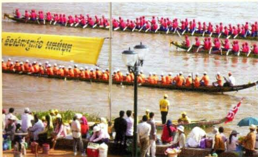
Đua thuyền tại Campuchia.

Bum-ooc-phăn-xả là ngày 14 tháng 11 lịch Lào (3 tháng 10 dương lịch). Ngày nay, lễ hội đua thuyền ở Lào được tổ chức cùng ngày với lễ hội Lầy-hùa Phay (thả bè nển) nhưng khác về thời gian. Cả hai lễ hội đều gắn với Phật giáo, đều nhằm tôn vinh thần Nác và tạ ơn nước đã đem lại cho người Lào có cuộc sống ấm no hạnh phúc. (*)