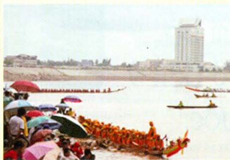
Đua thuyền trên sông Mê Kông ở Si Phan Don nước Lào.

Nam bộ, các nước Đông Nam Á tổ chức lễ hội đua thuyền. Nhưng về thời gian tổ chức, hình thức lễ hội và ý nghĩa lễ hội giữa người Khmer Nam bộ và các nước Đông Nam Á thì không giống nhau lắm.