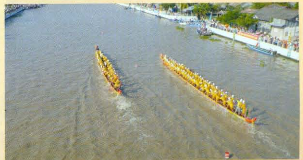
Đội ghe Ngo thành phố Cần Thơ tham dự cuộc đua nhân dịp Festival lúa gạo năm 2009 tại tỉnh Hậu Giang.

Đối với người Khmer Nam bộ thì đua ghe Ngo là hoạt động ứng xử với nước tiêu biểu nhất của họ, nghi thức diễn ra mấy hôm trăng tròn của tháng 10 âm lịch. Trong suốt 3 ngày, người Khmer từ các phum, sóc, ở các nơi đều đổ xô tập nập về cùng với chiếc ghe Ngo sẵn sàng tham gia đua. Tên của mỗi chiếc ghe Ngo thường thì cũng chính là tên của chùa và địa danh nơi xuất xứ của ghe, chi tiết này cho thấy ghe Ngo mang sắc thái tôn giáo và gắn cả với cộng đồng cư dân từng địa phương. Chính vì vậy mà chiếc ghe thắng cuộc sẽ đem lại niềm tự hào cho cả ngôi chùa lẫn địa phương đó. Những cuộc đua ghe Ngo thường được tổ chức chủ yếu và rầm rộ trên sông tại thành phố Sóc Trăng; gần cầu Long Bình phường 5, thành phố Trà Vinh; và một số địa phương trên địa bàn thành phố Cần Thơ; tỉnh Kiên Giang,... thu hút rất đông người từ các tỉnh thành lân cận, khách du lịch nước ngoài đến xem và cổ vũ rất náo nhiệt.