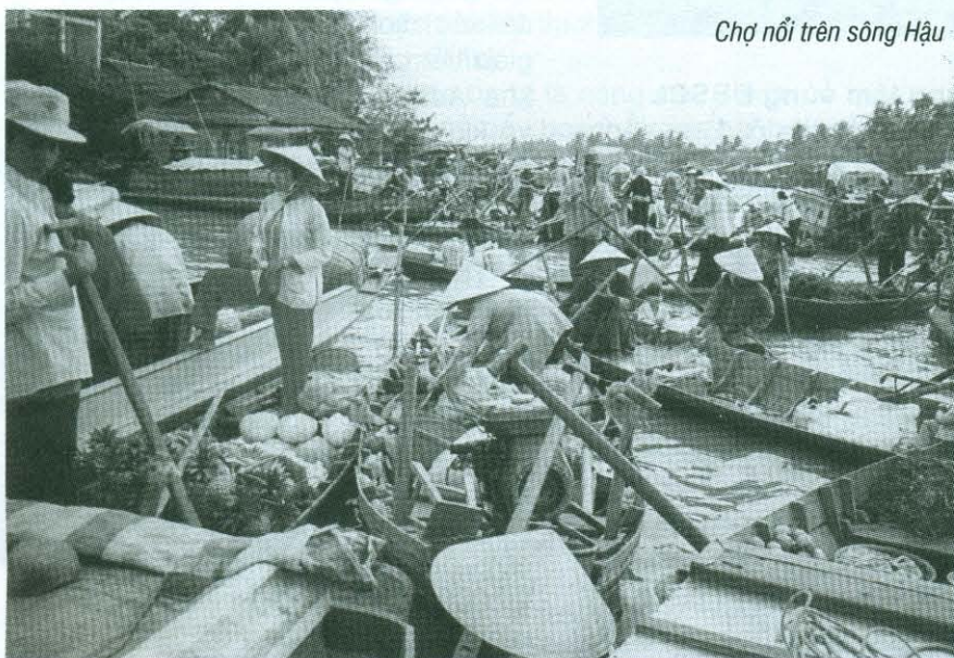
Chợ nổi trên sông Hậu

Trong tương lai Cần Thơ sẽ trở thành thành phố Sông nước - Xanh - Văn minh - Hiện đại và Phát triển bền vững. □