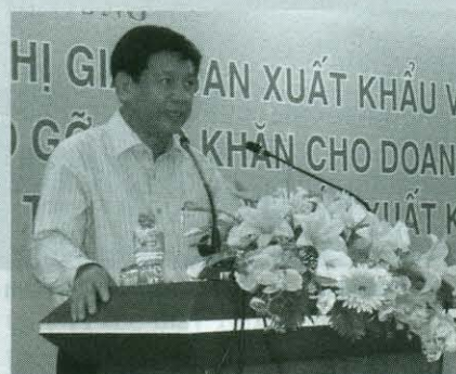
Thủ trưởng Bộ Công Thương Nguyễn Thành Biên

Trong những tháng còn lại của năm 2012, Bộ Công Thương sẽ tích cực cùng các Bộ ngành tháo gỡ khó khăn cho các DN xuất khẩu về vốn, lãi suất, thuế... để các DN xuất khẩu có thể hoàn thành tốt mục tiêu xuất khẩu đề ra trong năm 2012 này.