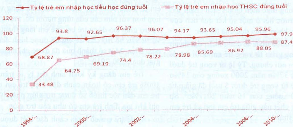
Hình 3: Tỷ lệ nhập học đúng tuổi bậc tiểu học và THCS của trẻ em Việt Nam các năm