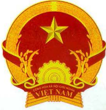
Quốc huy nước Cộng hòa XHCN Việt Nam