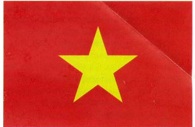
Quốc kỳ nước Cộng hòa XHCN Việt Nam

MỖI QUỐC GIA TRÊN THẾ GIỚI CÓ NHỮNG BIỂU TƯỢNG THỂ HIỆN CHỦ QUYỀN VÀ BẢN SẮC CỦA RIÊNG MÌNH. QUỐC KỶ TƯỞI THẨM, QUỐC HUY TOÀN DIỆN, QUỐC CA HÙNG TRÁNG XỨNG ĐÁNG LÀ BIỂU TƯỢNG THIÊNG LIÊNG, CAO QUÝ VÀ TỰ HÀO CỦA NƯỚC VIỆT NAM